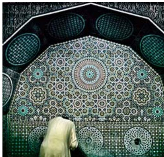
Fez, centro espiritual y cultural de Marruecos.