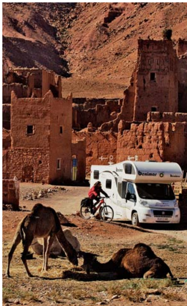
La autocaravana a su paso por la 'kasbah' de Tamdaght.