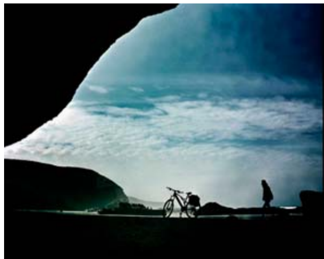
Otro alto en el camino: la playa de Legzira en Sidi Ifni.

tradicionales cuidados que vivifican cuerpo y espíritu.